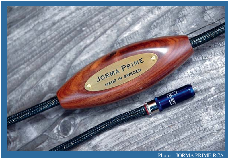
Photo : JORMA PRIME RCA

2006年1月ラスベガスCESにおいて、JORMA DESIGN(ヨルマ・デザイン)は従来のオーディオケーブルの概念に新たなパラダイムを提唱するJORMA PRIMEを発表いたしました。