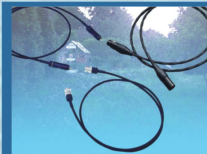
Photo : DIGITAL RCA, DIGITAL BNC, DIGITAL XLR