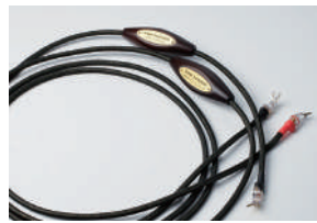
Photo: JORMA STATEMENT SPK

「ヨルマ・ステイトメント」のインターコネクトケーブルは、ヨルマ・デザインの完全新設計(2018年発売)によるものです。このインターコネクトケーブルは、ヨルマ・オリゴ及びヨルマ・プライムのインターコネクトの設計から更にワンランク上のステージに進化しました。このコンダクターは、最近まで製造不可能だったより一層細い高精度の直径0.05mmの銅糸の導体群でチューブを形成しており、銅の純度もこれまで限界とされていた8Nを凌ぐ9Nを実現しています。また、シールド技術の向上にも時間をかけました。このため、当シリーズのスピーカーケーブルの完成から更に数年の開発期間を要しました。これらすべてがこの「ヨルマ・ステイトメント」のインターコネクトケーブルに一段と高い完成度をもたらし、先行しているスピーカーケーブルに相応しいパートナーとして存分に期待に添えるクオリティに達しました。