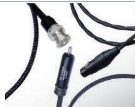
Photo: DIGITAL RCA, DIGITAL BNC, DIGITAL XLR

JORMA DIGITALは世界最高水準の精度で製造されたオーディオ・ケーブルであり、真のインピーダンス・マッチングを可能にする極めて高品位なデジタルケーブルです。JORMA DESIGNは小さな市場規模であるオーディオ用途としては破格の投資によって、ケーブル製造マシンの改良を行ない、優れた製品をお客様に提供しています。各種ケーブルの特性を十分に踏まえた上で、コネクタを厳選しました。