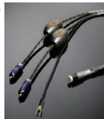
Photo: JORMA PHONO REFERENCE DIN-RCA