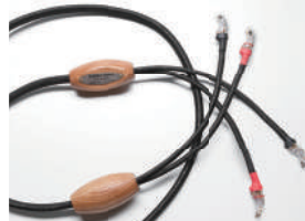
Photo: JORMA ORIGO SPK

* JORMA ORIGOのスピーカーケーブルに採用されているスピード(081社製)は、フォーク部の寸法が9mm、外寸が13.5mmです。