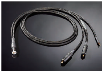
Photo: JORMA PHONO ONE DIN-RCA

※5PIN DIN コネクタはストレート・タイプを標準とします。 L字タイプをご希望の場合、特注にて承ります。