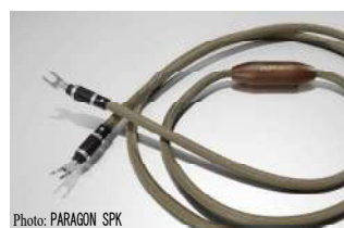
Photo: PARAGON SPK

Jorma Paragon (ヨルマ・パラゴン) は、ヨルマ・デザインの最新リファレンス・シリーズです。最高のクオリティを求めるオーディオシステムのために、それぞれが信号の純度を最大限に保つよう徹底的に設計されました。高純度銅導体の使用、マイナス 180°Cの極低温処理(クライオ処理)、精密なシールド構造により、Paragon シリーズのすべてのケーブルはシステムの潜在能力を最大限に引き出すために開発されています。ラインレベル信号、スピーカー駆動のいずれを伝送する場合でも、Paragon は驚異的な明瞭さとコントロールで信号を保ちます。Paragon シリーズの各ケーブルはスウェーデンで一本一本丁寧に手作業で製造され、「リスニング空間での完全な透明性」という唯一の目的のもとに作られています。使用されるのは、比類のない性能を実現するために厳選された最高品質の素材のみです。各 Paragon ケーブルは、独自の製造技術によって組み立てられ、卓越した導電性と機械的安定性を保証します。さらに、高度なシールド構造が電氣的・無線的・磁氣的な干渉を防ぎ、歪みや損失のない音楽本来のキャラクターをそのまま保ちます。