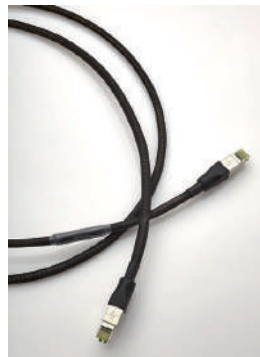
Photo: JORMA ETHERNET REFERENCE

今日のデータ転送のニーズは厳さが増すばかりです。そのため、ヨルマ・イーサネット・リファレンスのリリースは私達が長らく待ち望んだものです。超広帯域2,000MHzの伝送性能を備え、メディアプレーヤー、サーバー、PC、HD等をネットワークに完全に接続できる業界トップクラスのケーブルです。ヨルマ・イーサネット・リファレンスは非常に優れたクロストーク措置、低減衰、そして超低ジッターを誇っています。