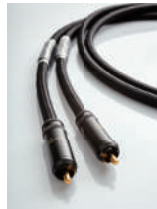
Photo : TRINITY RCA

JORMA TRINITYはエントリーモデルの価格ながら、最高峰JORMA STATEMENTの純血種としてオーディオケーブルの新しい境地を開拓しました。そして、ご使用されるエレクトロニクス機器の潜在能力を最大限に具現化してくれます。無垢、透明、躍動。それは、ヨルマ・トリニティー！