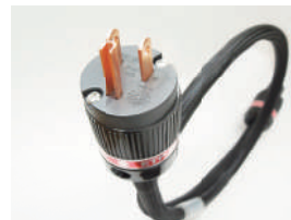
Photo: AC LANDA CU II

また厳しいPSE適合性同等検査の基準を遵守しながら、ハイエンドのサウンド・クオリティを追及することで膨大な時間を要しましたが、同時に安全で耐久力があり、長期に渡り安心してご使用いただけるACケーブルとなりました。輸入ACコードとしてはPSE適合性同等検査に合格した大変希少な商品となっています。