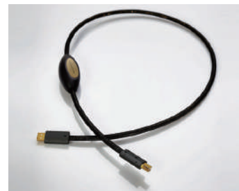
Photo: JORMA USB REFERENCE

ケーブルはすべてスウェーデンでハンドメイドされており、丈夫で耐衝撃性に優れたケースで届けられます。