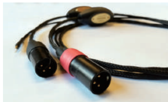
Photo: JORMA PHONO REFERENCE DIN-XLR

※5PIN DIN コネクタはストレート・タイプを標準とします。 L字タイプをご希望の場合、特注にて承ります。