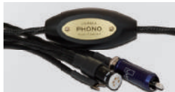
Photo: JORMA PHONO REFERENCE DIN-RCA

これまでヨルマ・デザインにフォノケーブルが存在しなかったのが不思議なくらいである。きっと相性はいいはずだから。最近では通常のインターコネクトケーブルが使用できるトーンアームもよくあるので、特に必要ないと言えばそれまでだが、本当にそうなのか？それを確かめられる日が遂に来てしまった。 同じトーンアームでRCA端子仕様のものでDIN端子仕様のもので比較試聴。同価格帯のヨルマ・デザインのインターコネクトケーブルを使ってみる。それ以外は同条件。インターコネクトケーブルはいつものヨルマの音だ。自然で音楽性がよく出ている。当然不満はない。今まで経験してきたフォノケーブルより情報量も多く、空間性も申し分ない。よって、特段フォノケーブルの必要性は感じられない。そして、このヨルマ・フォノで聴いてみる。 まさかである。極上のアナログ世界が浮かび上がってきた。今まで感じられなかったレベルの微細な音楽の動きやアトモスフィアが伝わってくる。明らかにヨルマ・フォノの方がレコード再生音における心地良さが増している。何故？構造の違い？精度？アース線？導体純度？何れにせよアナログレコードの再生に特化した設計のケーブルであることは間違いない。餅は餅屋ということなのであろうか。今さらだが、トーンアームにはやはりフォノケーブルが相応しいという結論に至ってしまう。