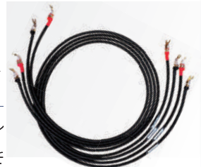
Photo : DUALITY SPK

ヨルマ・デザインのケーブルには何と言ってもナチュラルという言葉がよく似あう。このヨルマ・デュアリティーも例外ではない。銅素材そのものは従来モデルとほぼ同じだが、一聴して明らかな進化を感じた。やはりヨルマである。月並みなアップグレードでは済まなかった。その設計思想と製造技術の確固たる向上を認めざるを得ない。上位機種にあるヨルマ・デザイン独特の品格すら感じられる。音に滲みのない清らかさがあり、声や楽器の質感が一層現実味を帯びる。ステージのバランスも余計な誇張感は一切なく、極自然である。また音楽に没頭できそうだ。