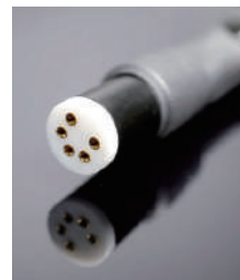
Photo: PHONO共通 5PIN DIN 端子