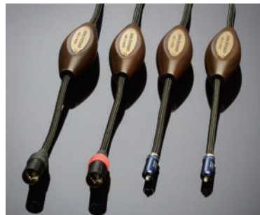
Photo: JORMA STATEMENT XLR, RCA

シールドングは、振動対策及びRFI/EMI除去の面からサイズ、マテリアル、編み方、製造方法に至るまで最適化を行いました。これにより、振動を緻密にダンピングし、マイクロフォニック効果に対して的確な処置を行います。同時に、スピーカーケーブルをインターコネクトケーブルや電源ケーブルに対し並行に配置したり、隣接したりしない限りは、RFI/EMIを効率的に除去します。